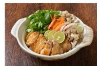
「和芹と石鶏の柚子味噌アロマ鍋」