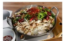
「薬膳きのこもつ火鍋」